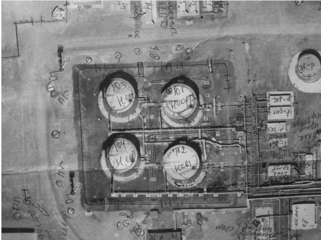
Рис. 1. Полевое дешифрирование аэрофотоснимка

Векторизация аэросъемочных данных и данных полевых измерений проводилась в программном комплексе ArcGIS (рис. 2). Согласно разработанной структуре базы геоданных, векторные картографические данные М-1:1000 состоят из следующих слоев: